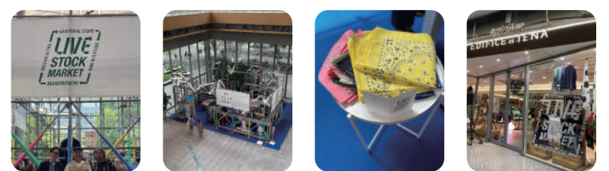
昨年開催されたライブストックマーケットの様子。